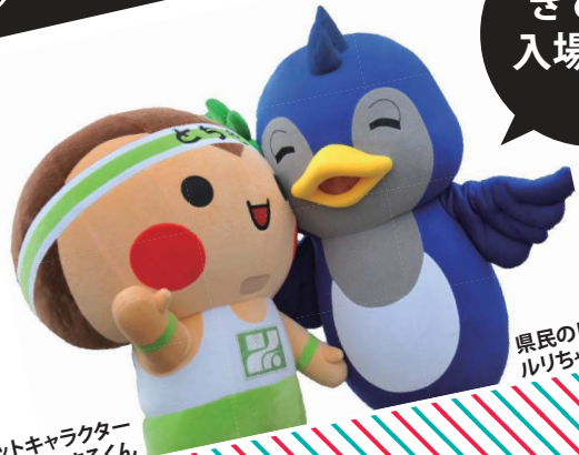
栃木県マスコットキャラクター とちまるくん